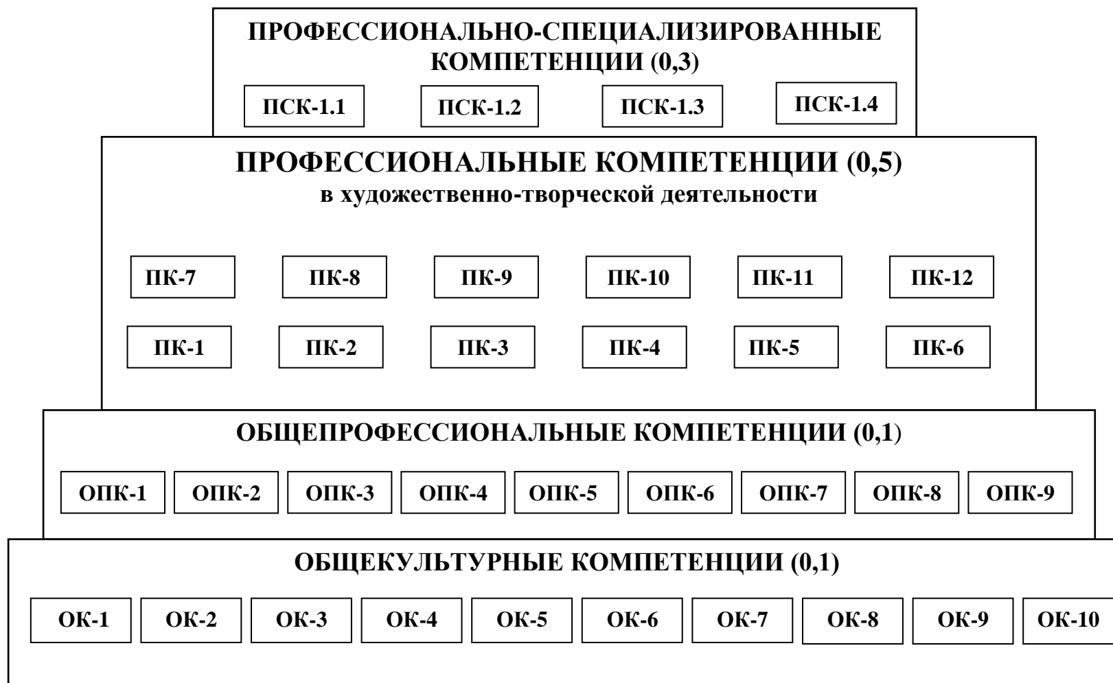
Схема компетентностной модели выпускника по основной профессиональной образовательной программе «Артист драматического театра и кино» Специальность 52.05.01 Актерское искусство